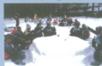
スノーテーブル作り&雪中パーティー