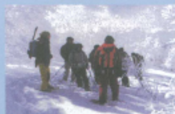
スノートレッキング