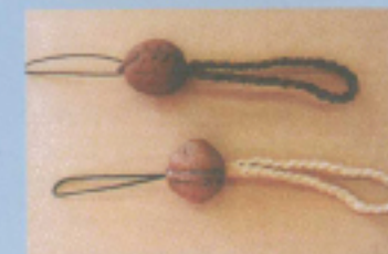
クルミのストラップ