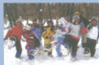
雪の森ウォッチング

スキーをしない生徒さんにも冬の楽しみ方いろいろ。森のキーホルダー、クルミのストラップ、木の時計作りやかご編みなど有意義な時間を過ごせます。