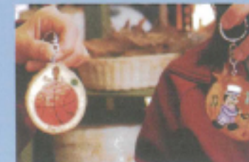
森のキーホルダー