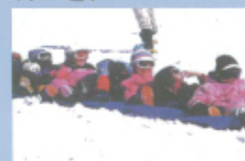
大雪原でソリ遊び