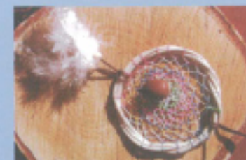
ドリームキャッチャー