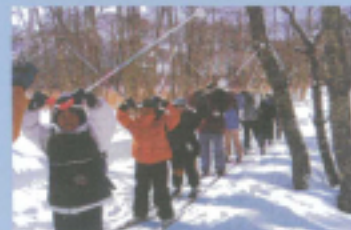
クロスカンントリー(歩くスキー)