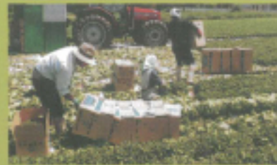
高原野菜収穫体験