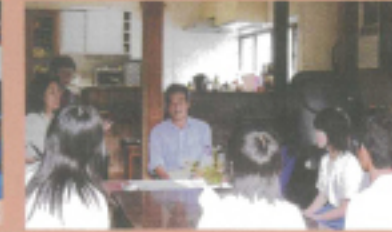
ふれあい…農村生活の話を聞く