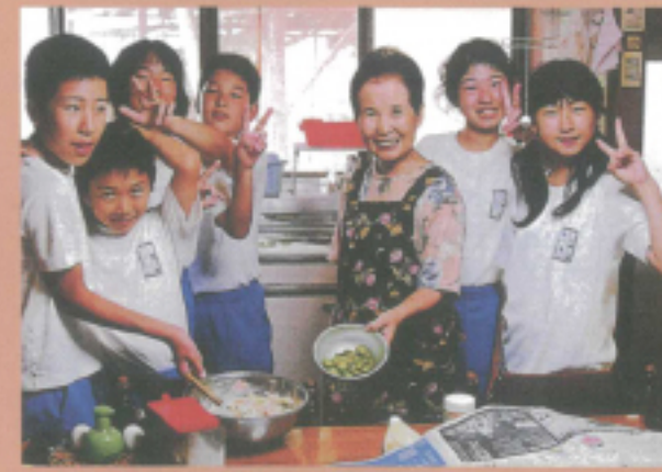
農山村の実情を知る「ほっとステイ」