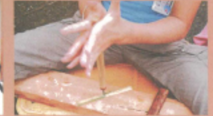
家でのてづな(手仕事)