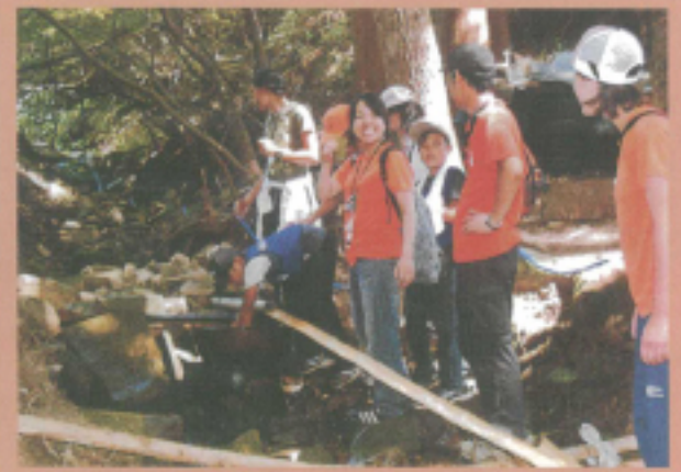
自然や環境の大切さを知ろう