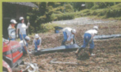
協力しあって作業体験