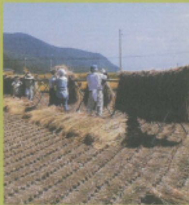
はぜかけのお手伝い