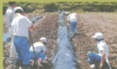
畑や田んぼでのお手伝い