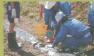
収穫の喜びを知ろう

※体験学習・環境教育プログラムのお問い合わせは——信用「えっこ村」〒390-1602 長野県小県郡青木村大字村松30-2(道の駅あき内) TEL0268-49-0122