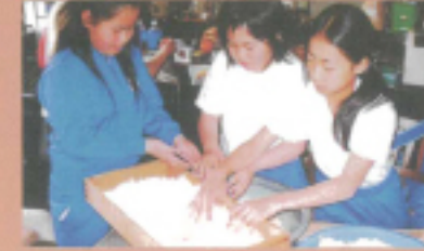
ありのままの農村体験